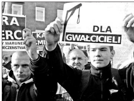
Faszysta pierwszy z prawej ma w klapie wpinkę Lechii Gdańsk