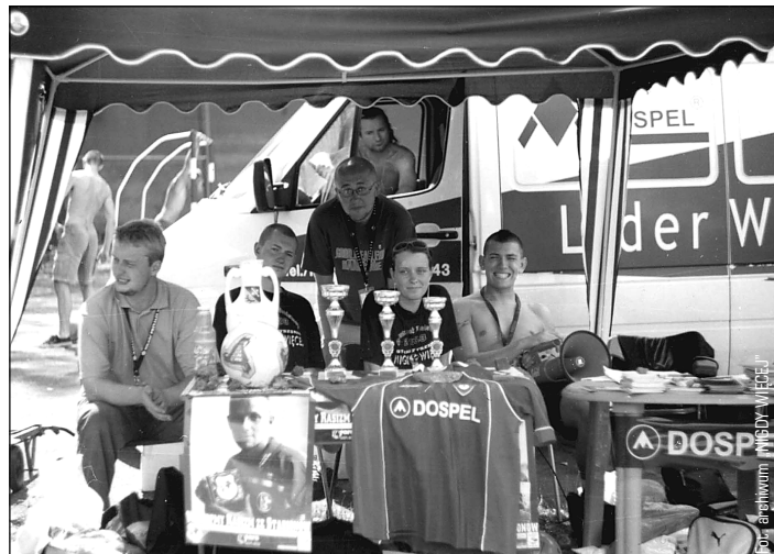
„Przystanek Woodstock 2003” – turniej „Wykopmy Rasizm ze Stadionów”