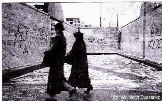
Sprofanowany pomnik na Umschlagplatz

WARSZAWA. 15 lutego na pomniku na Umschlagplatz pojawiły się faszystowskie symbole: swastyki, krzyża celtyckiego i gwiazdy Dawida na szubienicy i hasła typu Jude raus! namalowane ręką nieznanego bydlaka.