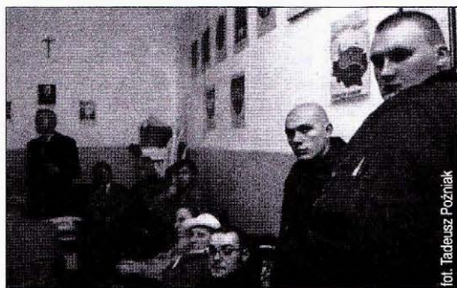
Młodzi „narodowcy” z Rzeszowa

RZESZÓW. 11 listopada grupa nazi-skinów związanych z Młodzieżą Wszechpolską i Stronnictwem Narodowym dołączyła do pochodu po mszy w kościele farnym pod pomnik gen. Władysława Sikorskiego w trakcie