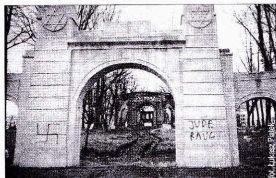
Swastyki na cieszyńskim cmentarzu

stycznia na świeżo wymontowanej bramie cmentarza żydowskiego pojawiły się namalowane czarnym sprayem hitlerowskie swastyki oraz napis