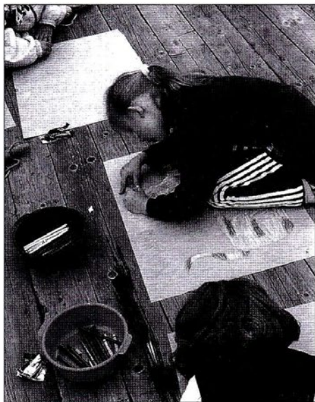
Wychowanie przez sztukę

sowali bowiem najmłodsi obywatele miasta Cieszyn, ich starsi koledzy ze szkół średnich, a także mamusie i tatusiowie, którzy wzorem swoich pociech nie chcieli być obojętni na sprawy ksenofobii i nietolerancji.