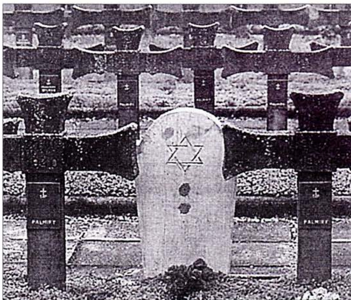
Profanacja w Palmirach

CIECHOCINEK. 27 lipca trzech Romów zostało pobitych w Parku Zdrojowym po Festiwalu Kultury i Piosenki Romskiej przez policję. Stróżę porządku najpierw wyzwali ich od czarnuchów i grozili utopieniem w Wiśle, a następnie przesłuchali. Jeden z Cyganów ma złamaną nogę, drugi nos, trzeci zębra.