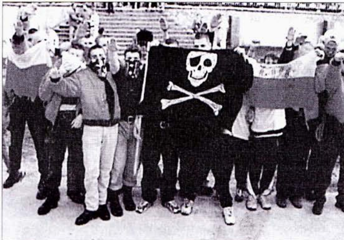
Neofaszyści, kibice ŁKS Łomża – 2 maja 1998

ŁOMŻA. 2 maja w trakcie trwania meczu III ligi piłki nożnej ŁKS Łomża – Jagiellonia Białystok banda zaprzyjaźnionych z sobą nazi-skinów, „kibiców” z obu miast wybrała się na „spacer” do centrum Łomży wszczynając po drodze burdy. Zaczepiali głównie ludzi wyróżniających się swoim wyglądem. Wszystko to działo się przy biernej postawie policji, jedyną konsekwencją wobec faszystów było niewpuszczenie ich z powrotem na stadion.