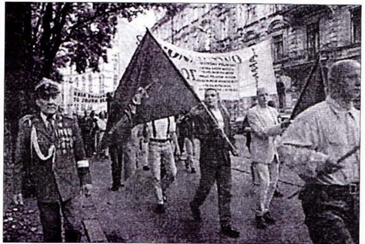
Nazi-skini i kombataneci manifestowali w rocznicę Grunwaldu w Krakowie