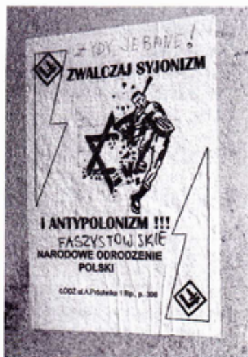
Antysemickie hasła i plakaty NOP na murach w Łodzi

LÓDŹ. Od dłuższego czasu trwa zmasowana akcja malowania antysemitycznych hasel na budynkach należących do instytucji mniejszości żydowskiej i miejscach upa-