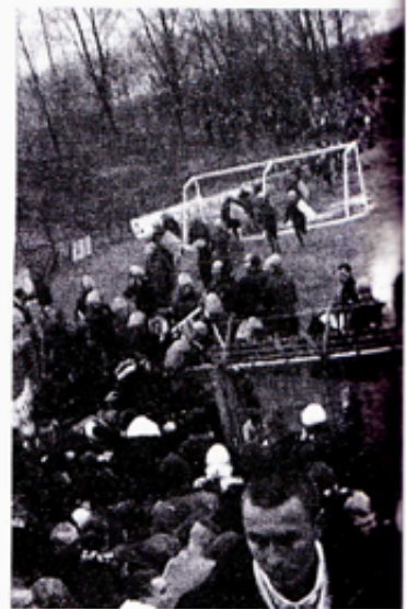
Nazi-kibice w Opolu

ŁOMŻA. Koniec listopada przyniósł całą serię ataków neofaszystowskiej bojówki na młodzieżowy klub „Zibi”. Efektem burdy było m.in. pobicie właściciela i jego syna, a także napad na ich mieszkanie. Sytuację uspokoiło dopiero przydzielenie lokalowi stałej ochrony.