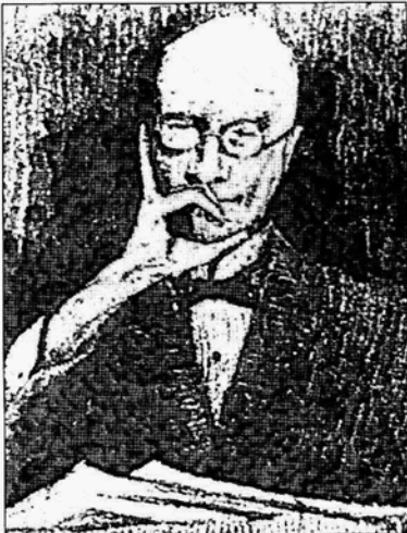
Eligiusz Niewiadomski – zabójca prezydenta Narutowicza.