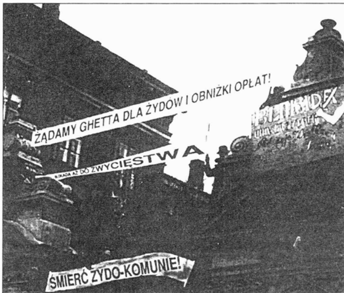
Hasła na bramie Uniwersytetu Warszawskiego podczas blokady w 1936 r.: „Żądamy ghetta dla Żydów i obniżki opłat”, „Niech żyje Wielka Polska”, „Śmierć żydokomunie”.

ływała w tym kierunku swoim przykładem. 131 Program antyżydowski tłumaczył skomplikowane, negatywne objawy życia społecznego, politycznego i gospodarczego. W grudniu 1931 r. w „Szczerbcu” (organie prasowym OWP) można było przeczytać m.in., że ambicją młodego pokolenia polskiego, dzisiaj wchodzącego w życie, jest rozwiązanie sprawy żydowskiej . 141 W tym samym czasie na wyższych uczelniach Młodzież Wszechpolska organizowała rozruchy antysemityczne. „Dzień Polski” tak komentował te wydarzenia: Narodowa Demokracja nie znajduje w tej sytuacji innego wyjścia, jak tylko wszczynanie, wzorem hitlerowców, pod hasłem obrony polskości, powszechnego zamętu. „Gazeta Warszawska” pisze językiem, który nawołuje już nie tylko do szerzenia zamętu, ale chwilami wręcz do pogromów . 151 W październiku 1931 r. z powodu zajęć antyżydowskich na Uniwersytecie Jagiellońskim zawieszono były tam przez tydzień zajęcia. Na Uniwersytecie Warszawskim także wszczęto rozruchy, które przeniosły się na ulicę. Bojówka OWP pobiła studentów żydowskich, kilkunastu z nich trafiło na pogotowie.