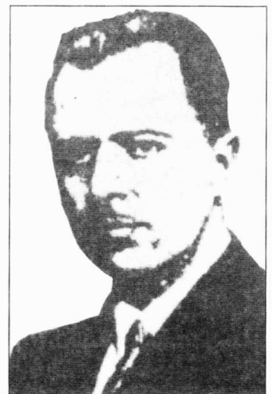
Jan Mosdorf – pierwszy przywódca i teoretyk ONR, zginął w Oświęcimiu, m.in. pomagając Żydom.