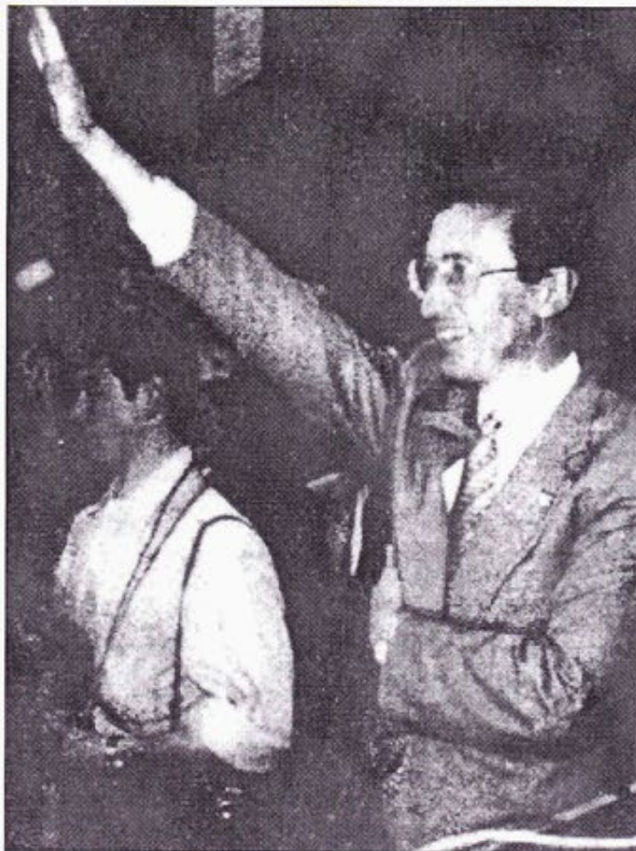
Gianfranco Fini, lider MSI/AN

Z upływem lat część grup neofaszystowskich zanikła bez śladu, inne po wielokroć zmieniały nazwy, formowały mniej lub bardziej trwałe sojusze, ulegały podziałom, a niekiedy delegalizacji. Ich sukcesem był jednak fakt, że faszyzm mimo pozorów wykorzenienia zdołał przetrwać jako identyfikowalna tradycja polityczna. Współcześnie działające organizacje neofaszystowskie mają na ogół swe korzenie we wspomnianych wyżej grupach powstałych w pierwszych latach po wojnie.