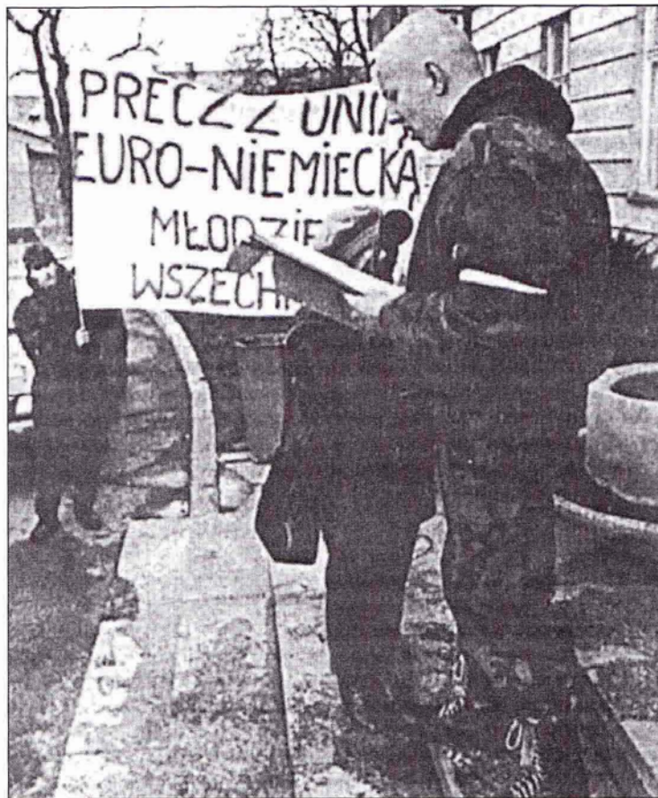
Młodzieżowy wszechpolak z Radomia.