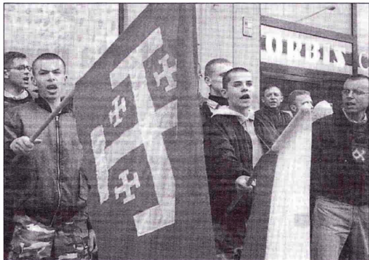
Nazi-skini z NOP i MW „witają” papieża.

WROCLAW. 2 czerwca podczas wizyty papieża grupa kilkudziesięciu nazi-skinów – członków NOP i Młodzieży Wszechpolskiej – próbowała zakłócić uroczystość skandując: Polska dla Polaków, Polska zawsze katolicka . Policja zareagowała natychmiast i do poważniejszych incydentów nie doszło.